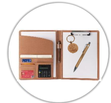
Conférencier avec calculatrice & stylo