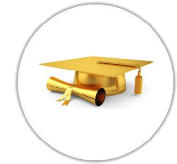
Attestation / Certificat de fin