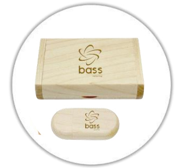
Clé USB 3.0 en bois gravé au laser