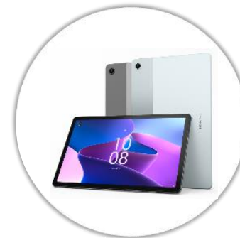
Tablette numérique avec clavier & pochette*