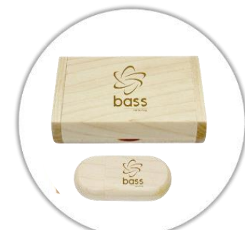
Clé USB 3.0 en bois gravé au laser