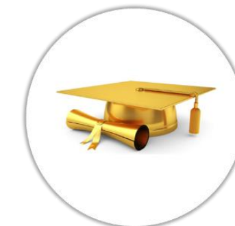
Attestation / Certificat de fin