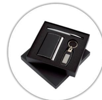
Coffret (porte carte de visite, stylo de luxe et porte clé en cuir) avec votre nom complet gravé au laser*