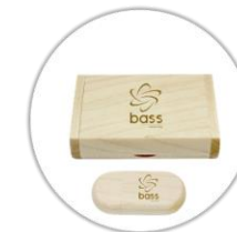
Clé USB 3.0 en bois gravé au laser