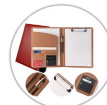
Conférencier avec calculatrice & stylo