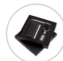
Coffret (porte carte de visite, stylo de luxe et porte clé en cuir) avec votre nom complet gravé au laser*