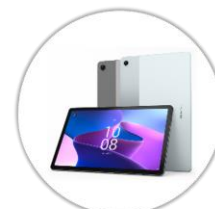
Tablette numérique avec clavier & pochette*