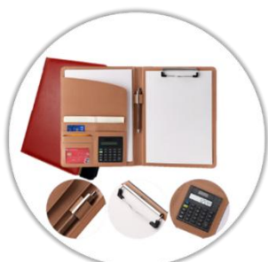
Conférencier avec calculatrice & stylo