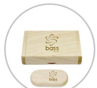
Clé USB 3.0 en bois gravé au laser