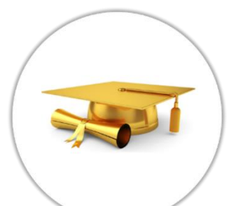
Attestation / Certificat de fin