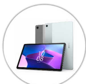
Tablette numérique avec clavier & pochette*