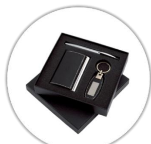
Coffret (porte carte de visite, stylo de luxe et porte clé en cuir) avec votre nom complet gravé au laser*